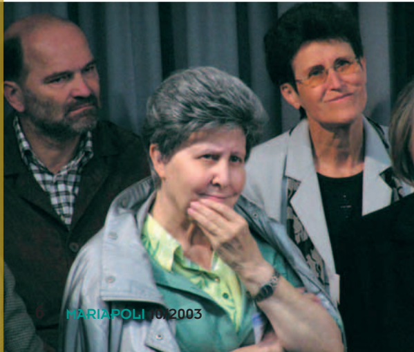
MARIAPOLI 6, 2003

In Austria quest'anno tutta l'Opera si era proposta di riavvicinare i giovani. Il progetto «Stile di vita per la pace» ha coinvolto