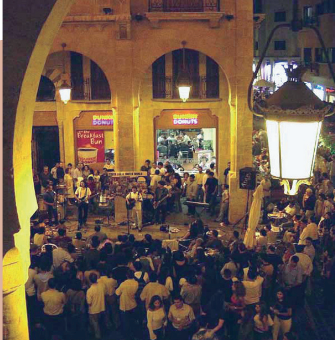
La conclusione della SMU per le strade di Beirut in Libano

«Non lasciatevi fermare dalle difficoltà che senz'altro ci sono e che sempre ci saranno», così Chiara incoraggiava i giovani nel suo messaggio, «ma fate dell'ostacolo stesso una pedana di lancio per un amore più grande, più profondo, più vero. Io sono con ciascuno di voi, sempre!» (vedi sotto). Queste parole hanno fatto centro nel cuore dei giovani. Numerose le risposte arrivate ancora in sera-