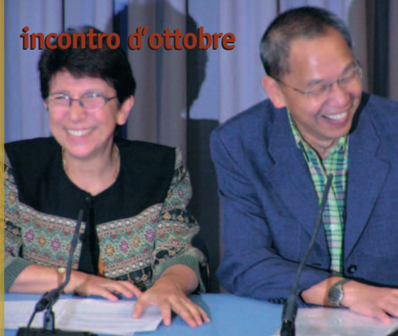
Sopra: con la zona della Thailandia e sotto: con i responsabili della Cittadella Luminosa negli Stati Uniti.

Chiara s'è presa particolare cura delle Cittadelle. Ora, tra incipienti e funzionanti, ne contiamo 33. Quando però si è trovata davanti la Mariapoli Ginetta, col suo centinaio di case, il polo Spartaco, la provvidenza arrivata proprio quel giorno per la costruzione della scuola «Aurora», non ha potuto che esclamare: « Basterebbe questa Cittadella per fare un'Opera ».